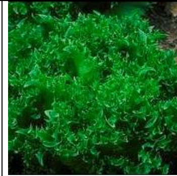
Lehtisalaatti Frillice an

Nopea lehtisalaatti Kylvetään suoraan avomaalle useampaan kertaan kesän aikana. Annoksessa 1 g/ 1000 siementä.