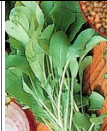
Rucola I. sinappikaali

Maukas ja mehevä. Syys- ja talvisalaatti Kylvetään huhti-kesäkuussa, itää 6-15 vuorokaudessa 18 asteessa. Annoksessa noin 800 siementä.