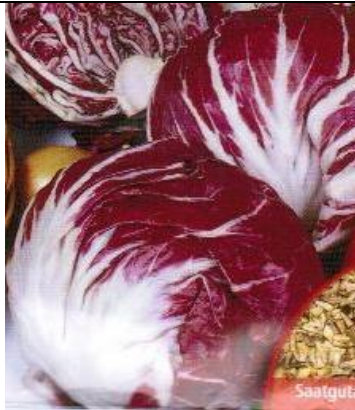
Punasikuri Palla Rossa

Parsan ja salaatin makuyhdistelmä. Käytetään sekä varret että lehdet. Lehdet poimitaan ja käytetään tuoreena, varret keitetään kevyesti. Kylvetään useampaan kertaan huhti-kesäkuussa, itää 6-15 vuorokaudessa, 10-16 asteessa. Kastelu on tärkeää kasvukaudella, sillä kuivuus tekee salaatista kitkerän makuista. Annoksessa noin 100 siementä.