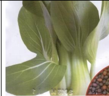
Pinaattikiinankaali Pak Choy

Satoisa. Kylvetään mahdollisimman aikaisin avomaalle. Kylvöksen voi uusi kesän aikana. Annoksessa noin 5 g/ 450 siementä