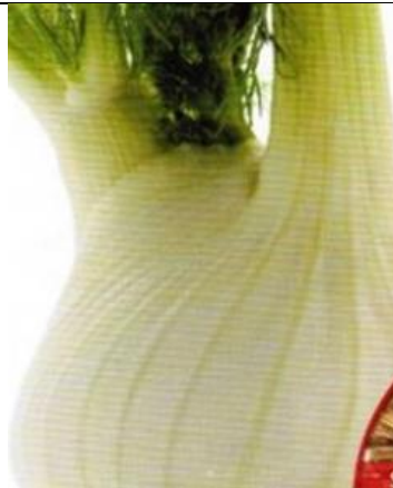
Salaattifenkoli Zefa Fino

Kylvö joko suoraan avomaalle tai esikasvatettuna. Mukulan muoto pyöreä, väri hieno valkoinen, Sadonkorjuu elo-syyskuussa. Annos noin 100 siementä. Siemen peitattu.