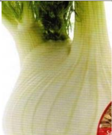
Salaattifenkoli Rondo F1

Erinomainen wokki-ruokiin. Hyvänlaatuinen, herkullinen. Lehtien alaosa on mehevää ja valkoinen, yläosa vaaleanvihreä. Kylvetään huhtikesäkuussa, siemen itää 7 vuorokaudessa 16 asteessa. Satoa saadaan 30-50 vuorokauden kuluttua. Sopii hyvin wok-ruokiin, mutta voidaan käyttää myös pinaatin tavoin. Annoksessa noin 100 siementä.