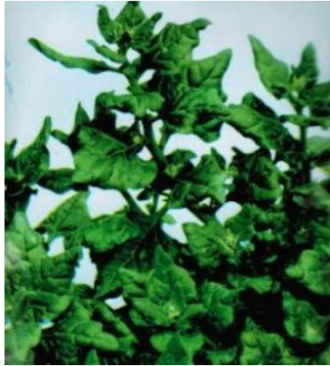
Pinaatti Lamopinatti Uudenseelannin