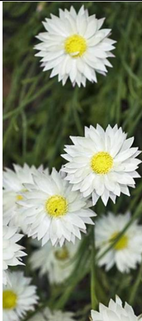
Herttaikukka valkoinen Rhodanthe manglesii

Korkeus 30 cm. Kylvetään suoraan avomaalle. Kukinta heinä-elokuussa.