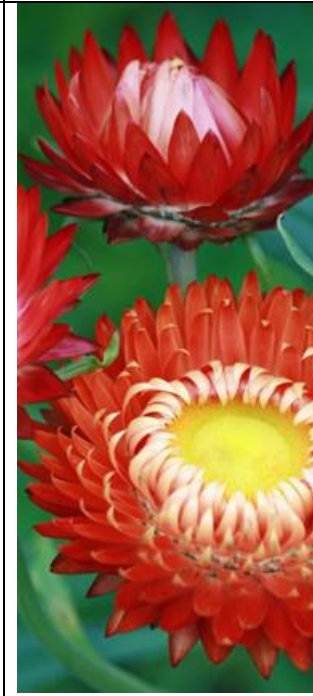
Iso-olkikukka Punainen Xerochrysum bracteatum.

Punainen. Kylvetään suoraan avomaalle. Suosittu kuivakukka. Kukat korjataan juuri kun ne avautuvat ja kuivataan. Annoksessa noin 200 mg/320 siementä.