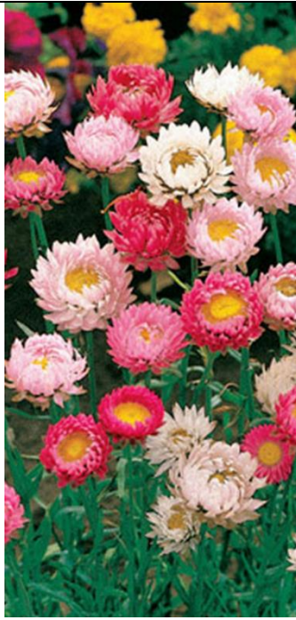
Iso-olkikukka Oranssi Xerochrysum bracteatum

Kylvetään suoraan avomaalle. Suosittu kuivakukka. Kukat korjataan juuri kun ne avautuvat ja kuivataan.