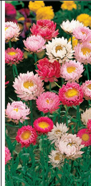
Iso-olkikukka Bikini matala sekoitus Xerochrysum bracteatum

Korkeus 30 cm. Kylve- tään suoraan avo- maalle. Itää 10-20 vuorokaudessa 16-18 asteessa. Kukinta hei- näsyyskuussa. Suosittu kuivakukka. Kukat korjataan juuri kun ne avautuvat ja kuivataan.