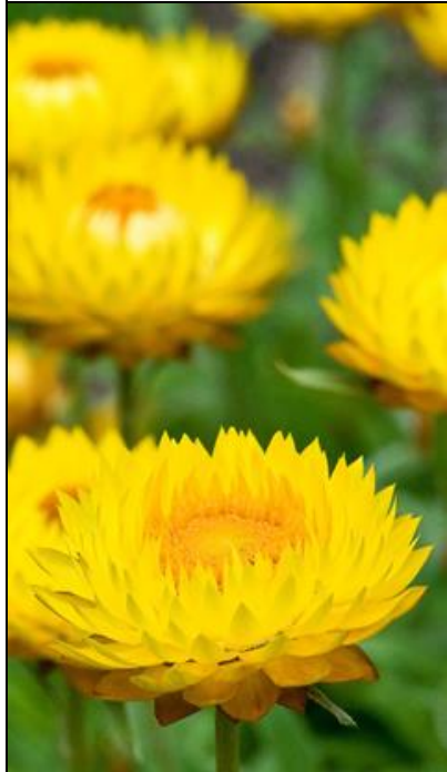
Iso-olkikukka Golden Yellow Xerochrysum bracteatum

Kullankeltainen. Kylvetään suo- raan avomaalle. Suosittu kuiva- kukka. Kukat korjataan juuri kun ne avautuvat ja kuivataan.