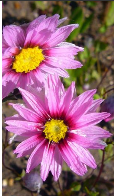
Herttaikukka ruusunpunainen Rhodanthe manglesii

Korkeus 30 cm. Kylvetään suoraan avomaalle. Kukinta heinä-elokuussa.